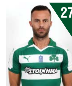
27 ΤΖΙΑΝΤΟΜΕΝΙΚΟ ΜΕΣΤΟ ΑΜΥΝΤΙΚΟΣ Ημ. Γέν.: 25/05/1982 • Ύψος: 1.81 μ. Τόπος Γέν.: ΜΟΝΟΠΟΛΙ